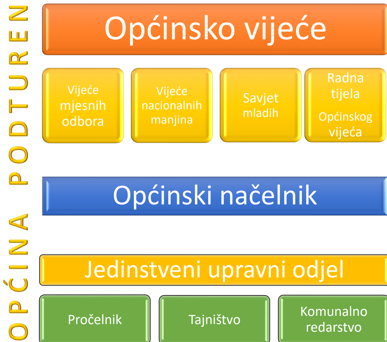
Tablica 16: Ustrojstvo Općine Podturen

Općinskog vijeća kao predstavničkog tijela, Vijeća Mjesnih odbora, Vijeća nacionalnih manjina, Savjeta mladih, radna tijela Općinskog vijeća, općinskog načelnika kao izvršnog tijela te Jedinstvenog upravnog odjela.