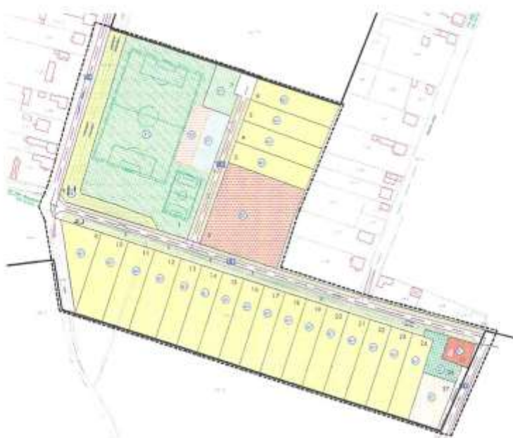
Prikaz 1 Područje obuhvata DPU

Detaljni plan uređenja stambene zone u Celinama počeo se primjenjivati temeljem Odluke o donošenju Detaljnog plana uređenja stambene zone u Celinama, po objavi u „Službenom glasniku Međimurske županije“ broj 9/04.